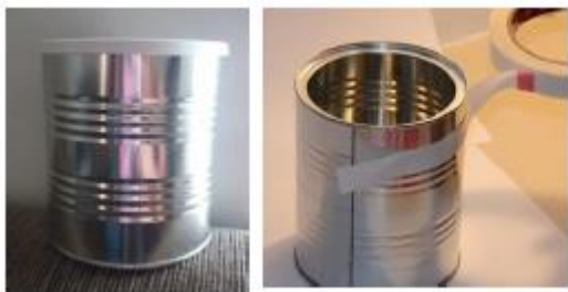
LATA de 400g

2) – Escolha uma LATA, use a cola ou a dupla face;